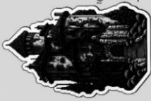
Дворецът на цари-зурпатор Марсел