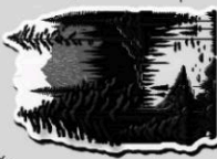
Горичката с езерцето с Живата вода