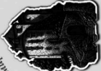
Дворецът на Бронимир Велики