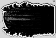
Гората с прохода на каскимората