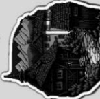
Селото с черешовото дърво