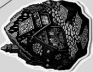
Градът на Целностите