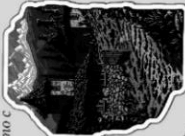
Селото на добрите дворци